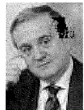
IL MINISTRO Maurizio Sacconi ministro del Welfare

“Problemi seri da fine anno quando si faranno sentire gli effetti della cassa integrazione”