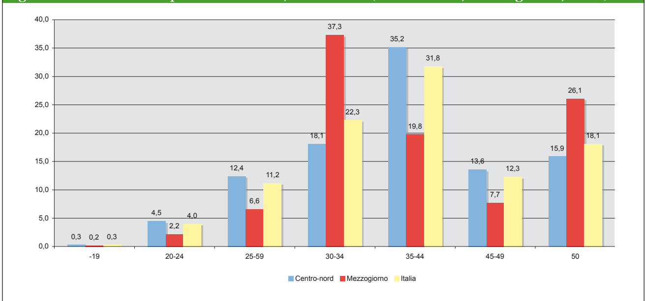
Figura 2.2 - Beneficiari per classe di età, 2000-2007 (Centro-nord, Mezzogiorno, Italia)

Fonte: elaborazioni Isfol – Area Valutazione Politiche Risorse Umane su dati Mef-Igrue