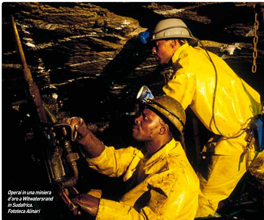
Operai in una miniera d'oro a Witwatersrand in Sudafrica.