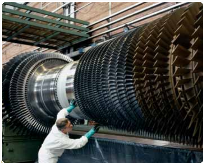
Industria Gtt Siemens, 2005, Torino.