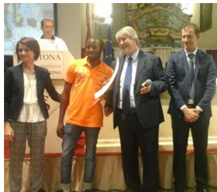
Il Ministro del Lavoro e delle Politiche Sociali in visita a Cortona

Il progetto “All’opera per il bene comune” riassume, già nel titolo, l’intento di provocare un cambio di mentalità nel modo di concepire la realtà che ci circonda, passando da una visione individualistica ad una visione che tende alla ricerca del bene comune, nella prospettiva che gli abitanti della città siano protagonisti attivi e consapevoli del contesto in cui vivono, alimentando i valori e i principi della comunità. I volontari che finora hanno aderito al progetto sono stati coinvolti nelle seguenti attività: distribuzione a tutte le famiglie di Cortona del kit per sviluppare la raccolta differenziata porta a porta, mantenimento del decoro urbano nel centro storico di Cortona, manutenzione del verde pubblico.