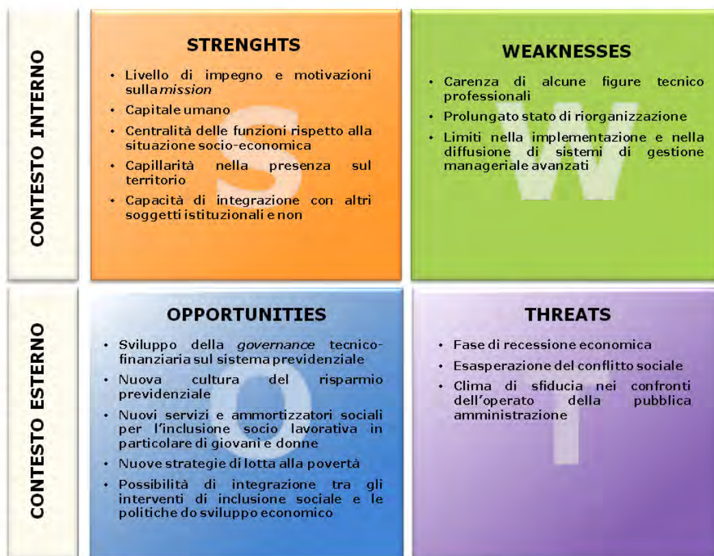
Figura 5 – Analisi SWOT

Nel 2013, l'Amministrazione si è impegnata, in un'ottica di progressiva implementazione e di gradualità e, in continuità con l'attività avviata nell'esercizio precedente, nella prosecuzione del complesso processo di gestione del ciclo della performance , ai sensi del dettato normativo del decreto legislativo n. 150/2009.