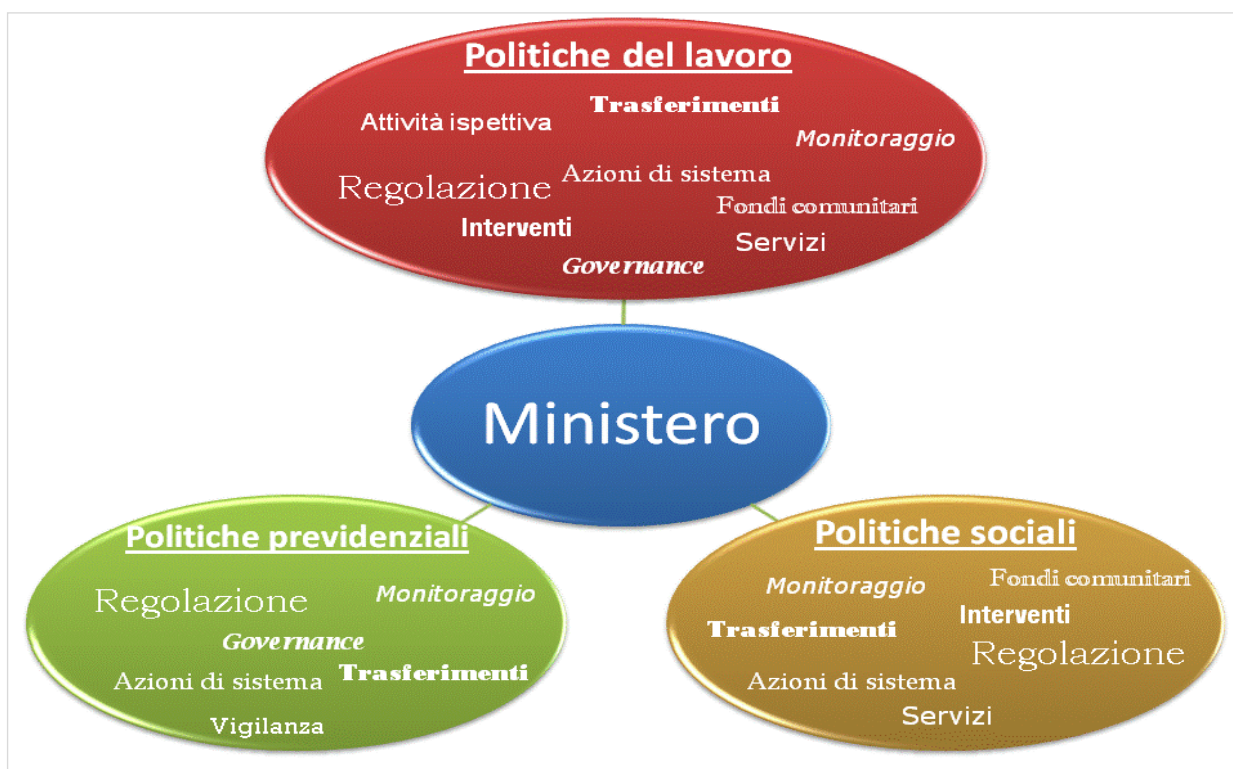
Figura 1 - Macro-ambiti di intervento

Lo schema che segue esemplifica le tipologie di attività ministeriali maggiormente qualificanti nei diversi macro ambiti di intervento.