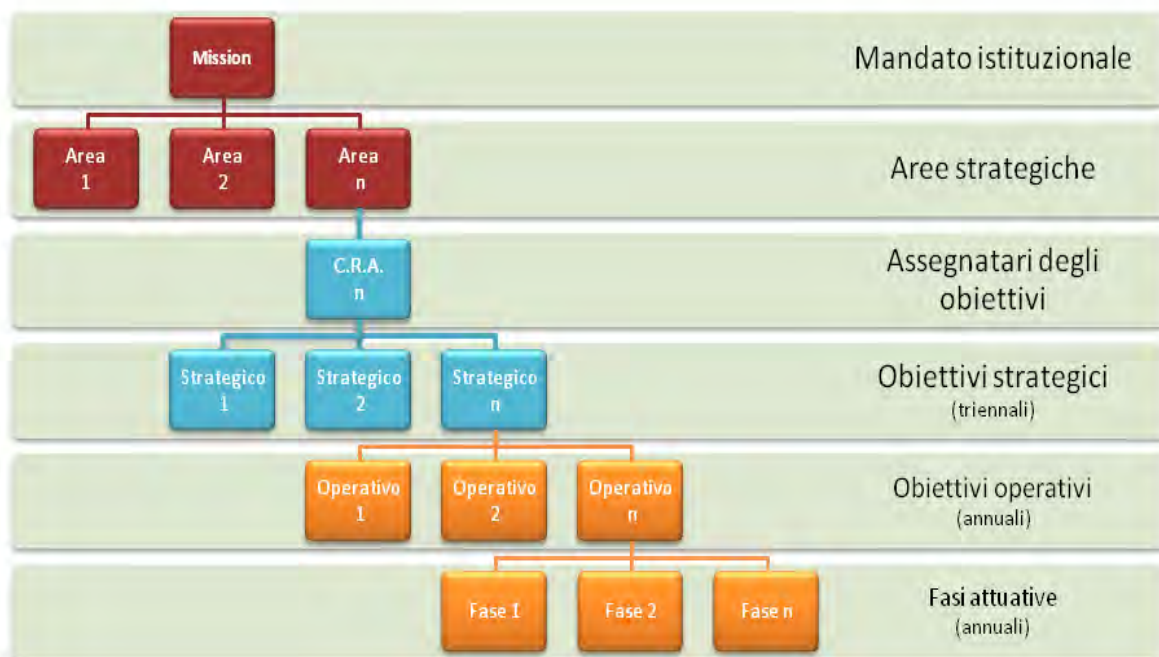
Figura 4 – Albero della performance : collegamento tra mandato istituzionale ( mission ), aree strategiche e obiettivi

Dal piano d'azione stabilito nella Direttiva generale annuale per l'azione amministrativa e la gestione discendono a loro volta – secondo lo schema seguente – gli obiettivi operativi annuali assegnati con le cosiddette “ direttive di II livello ” ai dirigenti di II fascia, ossia ai titolari di uffici dirigenziali non generali.