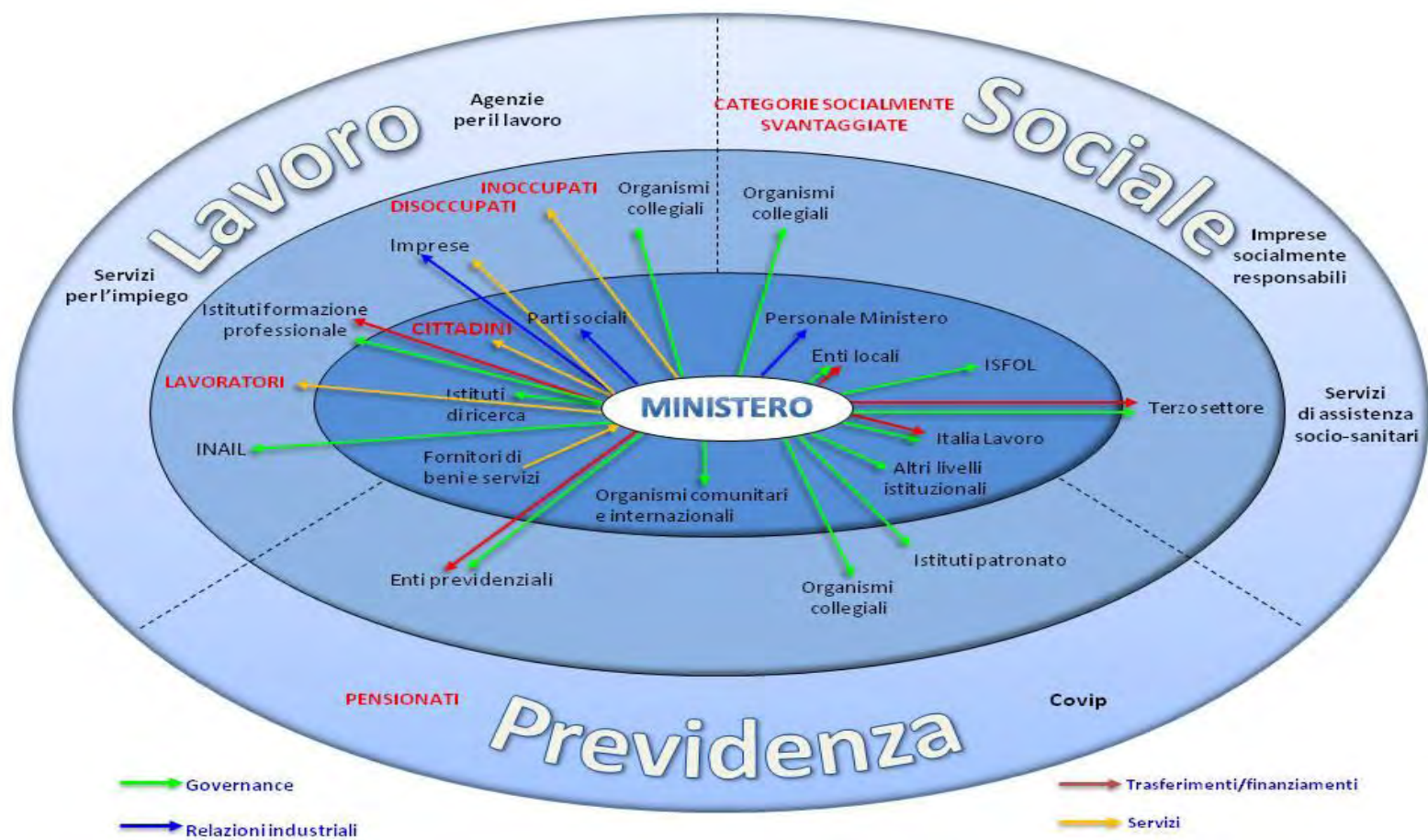
Figura 3 - Rete delle relazioni tra l'Amministrazione ed i principali soggetti esterni coinvolti