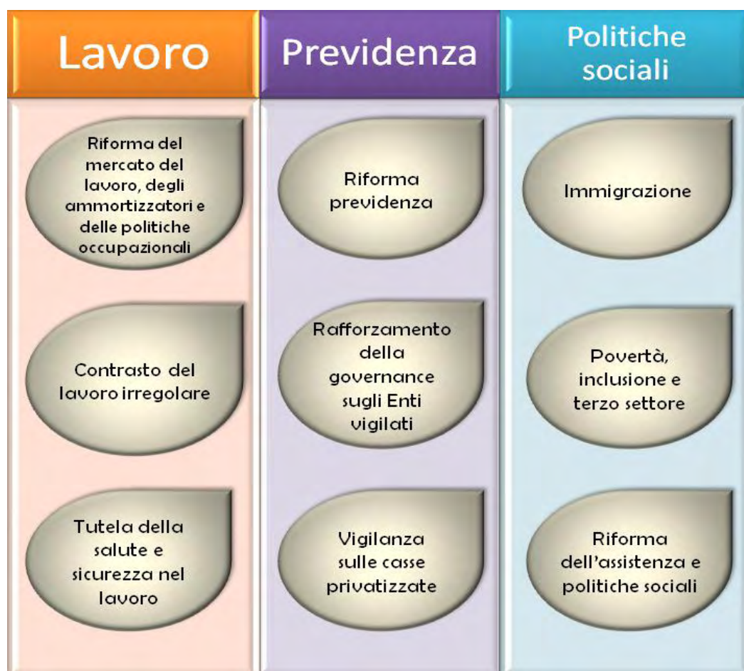
Figura 2 - Aree strategiche del Ministero del lavoro e delle politiche sociali

Inoltre, per una rappresentazione sintetica degli ambiti di intervento si propone di seguito uno schema delle aree strategiche che, in funzione degli indirizzi politici e della situazione socio-economica del Paese, costituiscono il terreno specifico di formulazione delle politiche pubbliche e, di conseguenza, il presupposto sia della programmazione economico-finanziaria che della programmazione strategica.