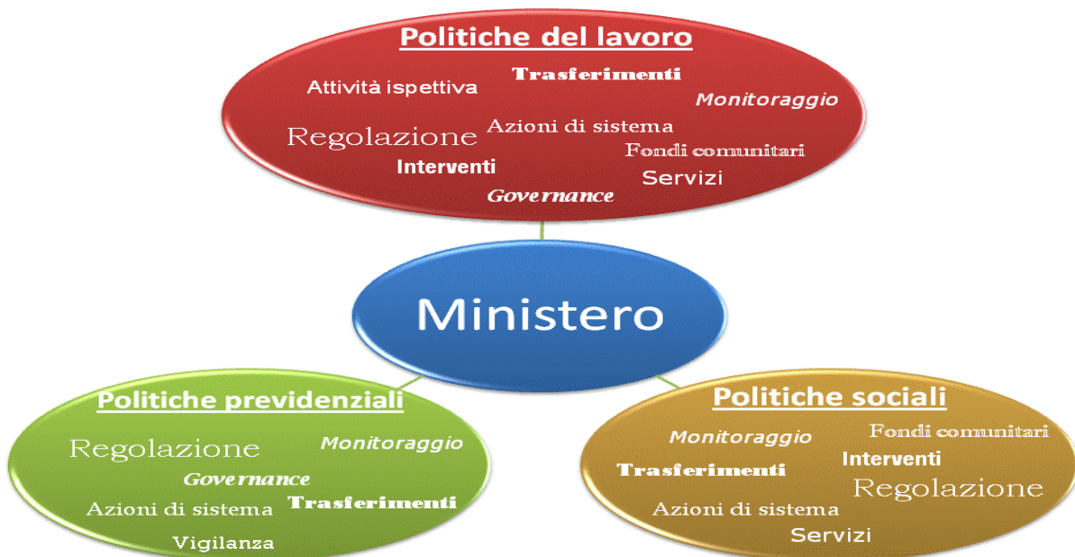
Figura 1 - Macro-ambiti d'intervento e attività corrispondenti

La figura successiva ( Figura 2 ) riporta uno schema delle aree strategiche che, in funzione degli indirizzi politici e della situazione socio-economica del Paese, costituiscono il terreno specifico di formulazione delle politiche pubbliche e, di conseguenza, il presupposto sia della programmazione economico-finanziaria che della programmazione strategica.