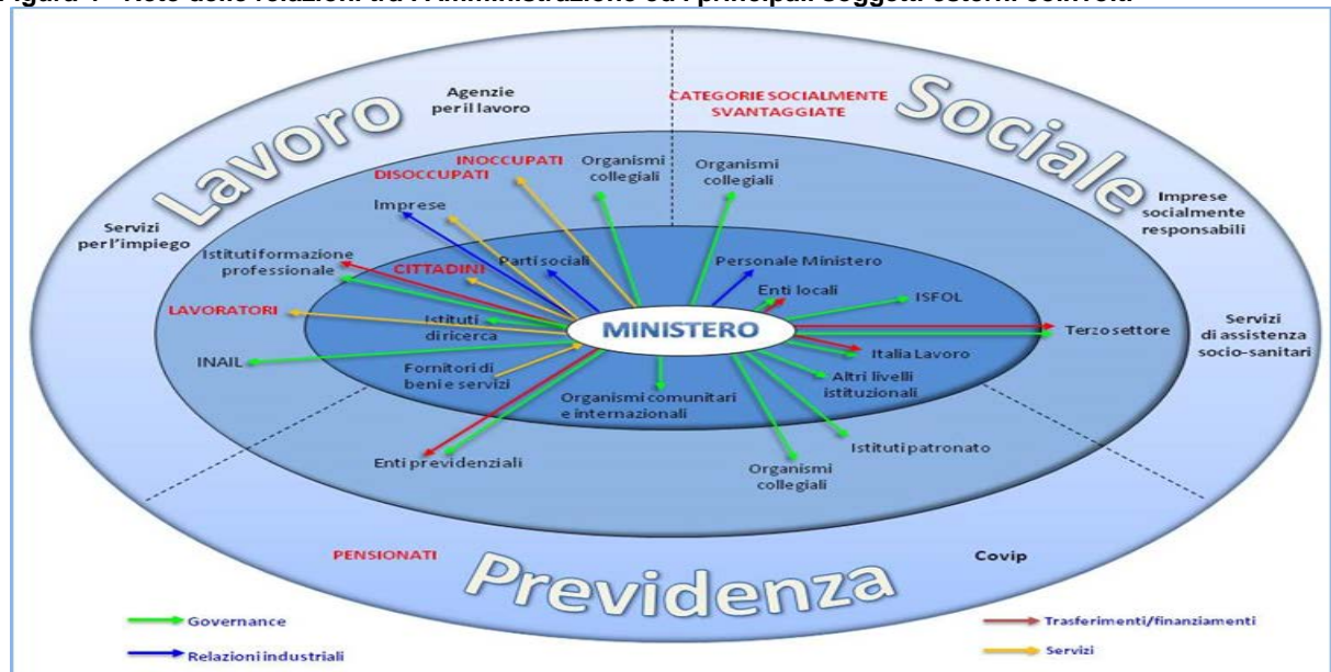
Figura 4 - Rete delle relazioni tra l'Amministrazione ed i principali soggetti esterni coinvolti