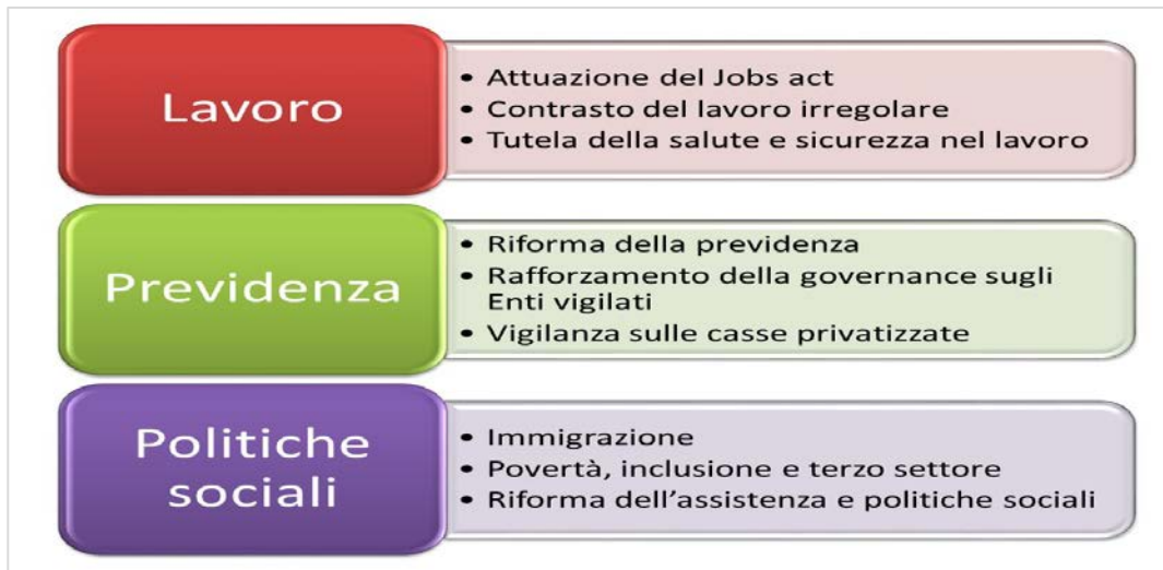
Figura 2 - Aree strategiche del Ministero del lavoro e delle politiche sociali