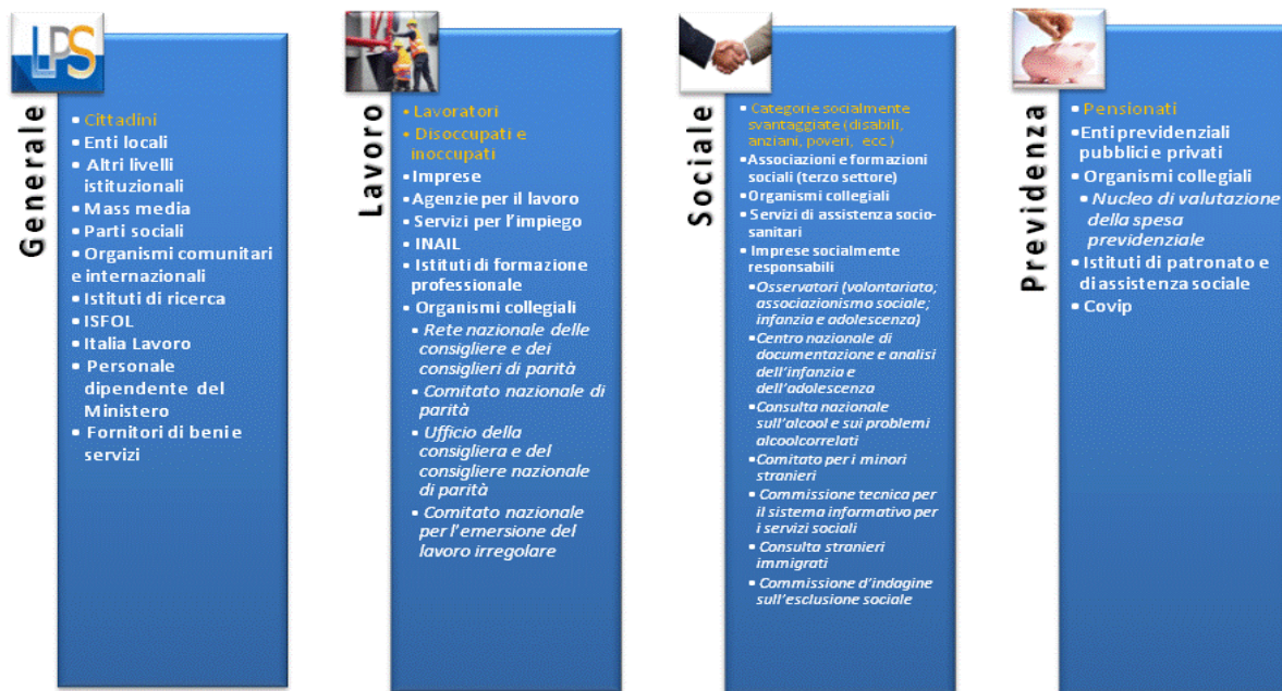
Figura 3 – Principali stakeholder distinti per settore

Le relazioni con questi soggetti assumono molteplici caratteristiche e differenti livelli di intensità. Di seguito si riporta una sintesi - non esaustiva - delle varie tipologie di relazioni tra la struttura ministeriale ed i soggetti esterni comprende: