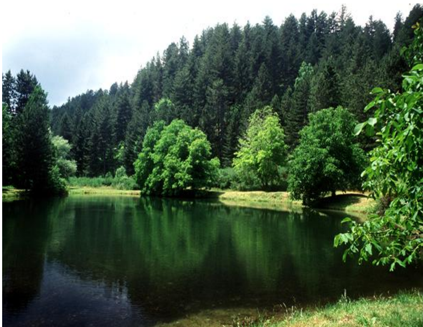
“Parco Nazionale della Sila”

DIREZIONE TERRITORIALE DEL LAVORO VIA PIETRO DE ROBERTO, 34 87100 COSENZA Tel. 0984/652211 – Fax 0984/412463 E mail: DPL-Cosenza@lavoro.gov.it P.E.C. : DPL.Cosenza@mailcert.lavoro.gov.it