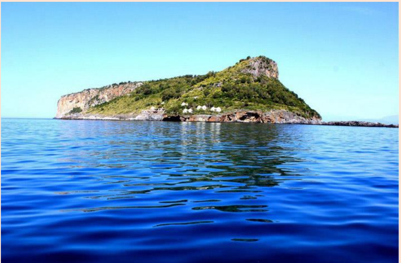
(Isola di Dino)

Ministero del Lavoro e delle Politiche Sociali