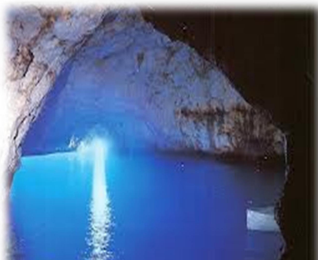
“Isola di Dino - Praia a Mare”