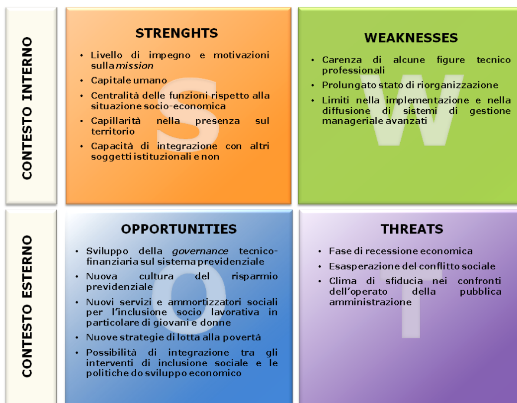
Figura 5 – Analisi SWOT

Nel corso dell'anno di riferimento, l'Amministrazione si è impegnata, in un'ottica di progressiva implementazione e di gradualità ed in continuità con l'attività avviata nell'esercizio precedente, nella prosecuzione del complesso processo di gestione del ciclo della performance, come previsto dal decreto legislativo n. 150/2009.