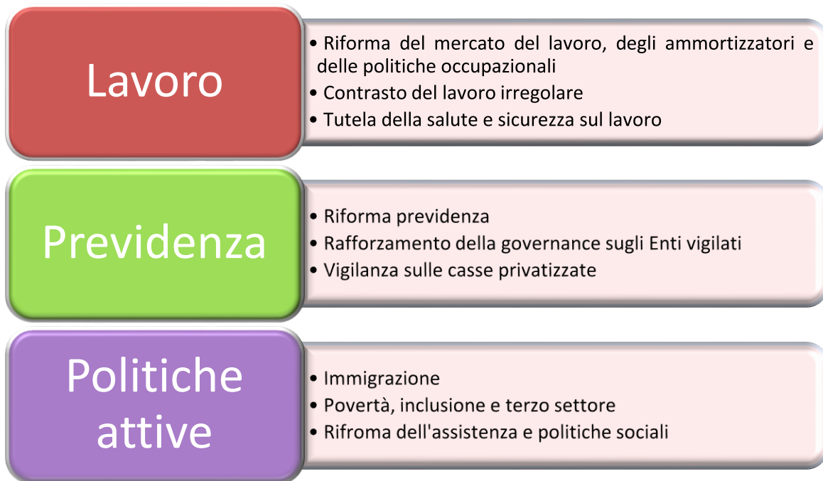
Figura 2 - Aree strategiche del Ministero del lavoro e delle politiche sociali

La figura successiva (Figura 2) riporta uno schema delle aree strategiche che, in funzione degli indirizzi politici e della situazione socio-economica del Paese, costituiscono il terreno specifico di formulazione delle politiche pubbliche e, di conseguenza, il presupposto sia della programmazione economico-finanziaria che della programmazione strategica.