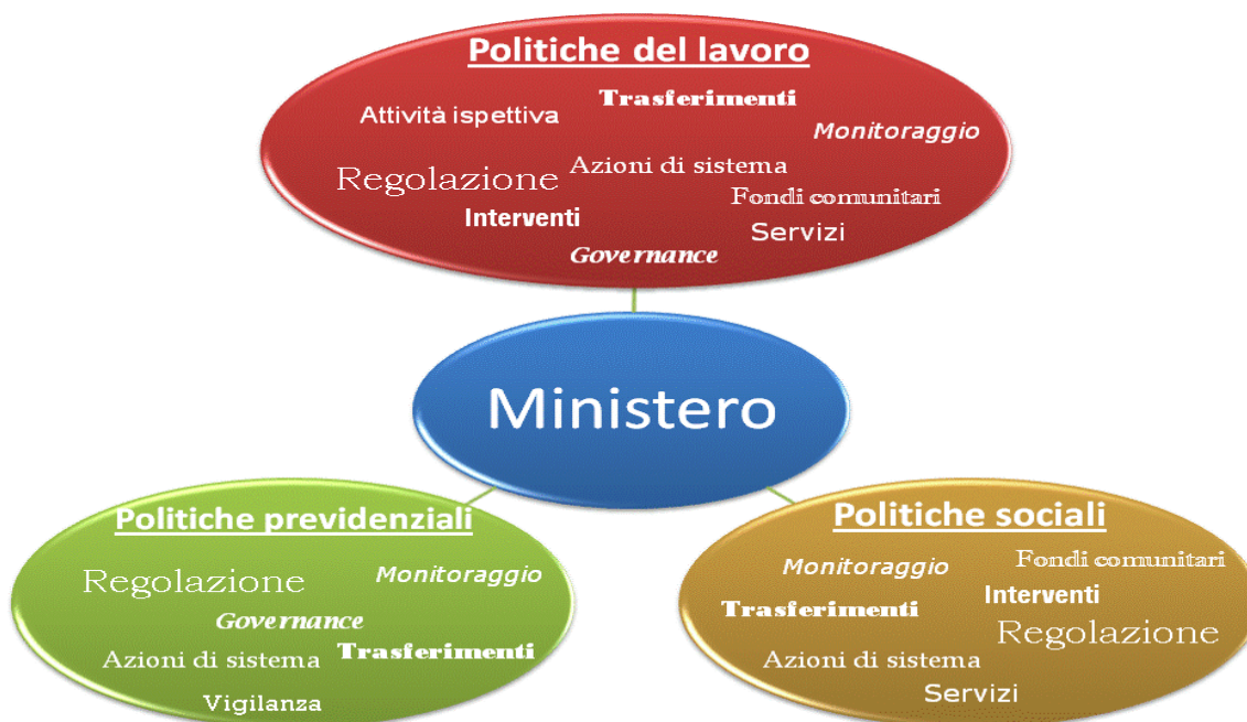
Figura 1 - Macro-ambiti di intervento

Lo schema che segue ( Figura 1 ) rappresenta una sintesi delle attività ministeriali nei diversi macro-ambiti di intervento.