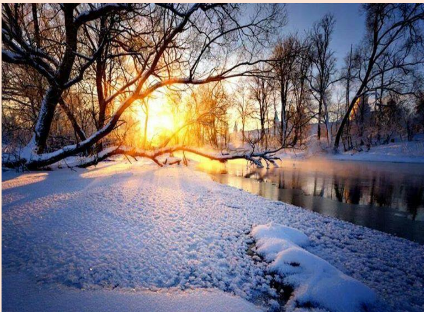
Immagini della Sila innevata

Ministero del Lavoro e delle Politiche Sociali